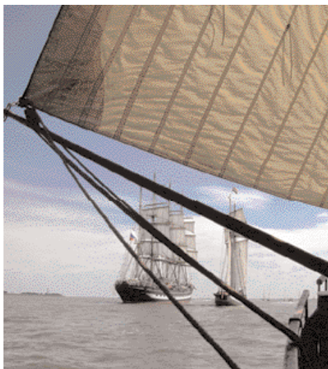
Beloodsing tijdens Sail Amsterdam.