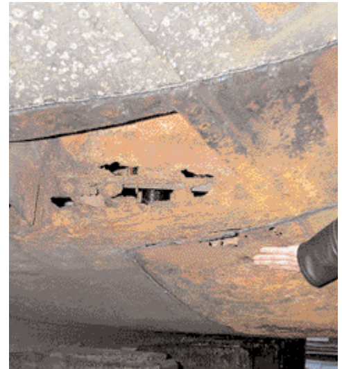
Dit gedeelte van de huid is duidelijk aan vervanging toe. De gaten vallen er in.

M.J. Koenen, J. Endepols; Verklarend Handwoordenboek der Nederlandse Taal; J.B. Wolters; zesentwintigste druk; Groningen 1966.