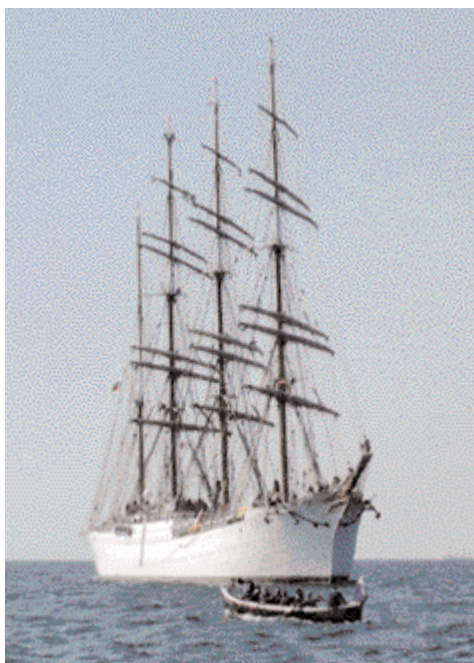
Beloodsing van de Sedov.