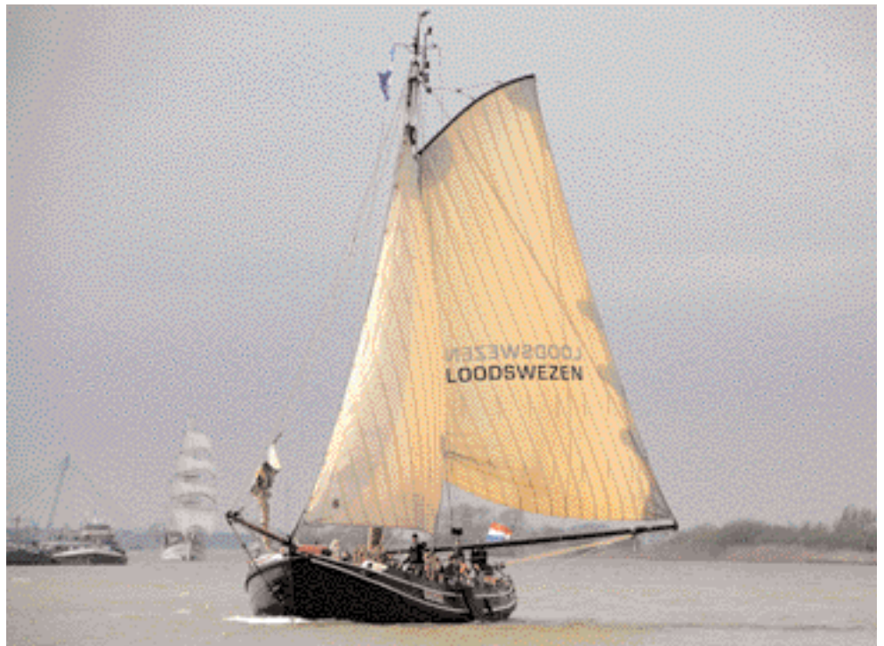
Deelname aan Sail Kampen 2007.

sen van de werf het fundament legden. Ijmuiden, Scheveningen, Rotterdam, bij het invaren van de Nieuwe Waterweg, wordt dankzij de nieuwe letters LOODSWEZEN de loodsbatter direct herkend en vriendelijk toegezwaaid vanaf de brug van een binnenlopend zeeschip. Ook de KLPD Hoek van Holland is enthousiast. Hoek van Holland bood ligplaats aan de loodsbatter van 1922 tot 1925. In de Madroelhaven van Pernis wacht een hartelijk welkom aan de steiger van Ecoloss. Met Ecoloss worden de deelnemers aan de Race of the Classics uitgeleide gedaan over de Nieuwe Maas. Het eigenlijke doel van de reis is een bijdrage leve-