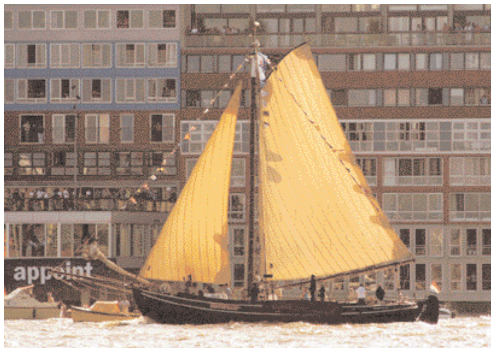
De Texelstroom in avondlicht tijdens Sail 2005.

Vanaf dit jaar vullen de winters zich met regulier onderhoud, kleine verbeteringen, de jaarlijkse keuringsperikelen en exploitatieberoerselen.