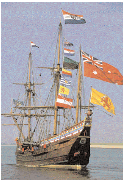
Ook bij de Duyfken wordt een loods met een loodsjol aan boord gebracht.