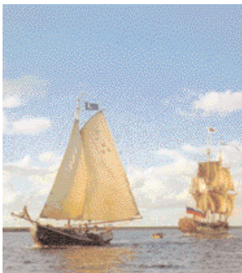
Beloodsing van de Shtandart.