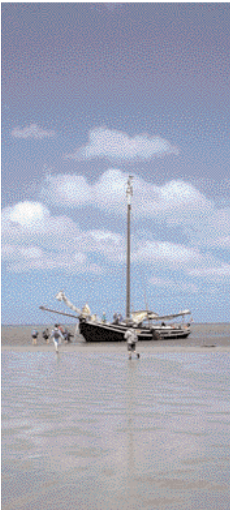
Excursie op het Wad.

Bovenstaand vaarplan is weersafhankelijk. Hoek van Holland-Delfzijl en Delfzijl-Oudeschild kunnen separaat worden geboekt. Meer informatie is voorhanden bij het boekingskantoor.